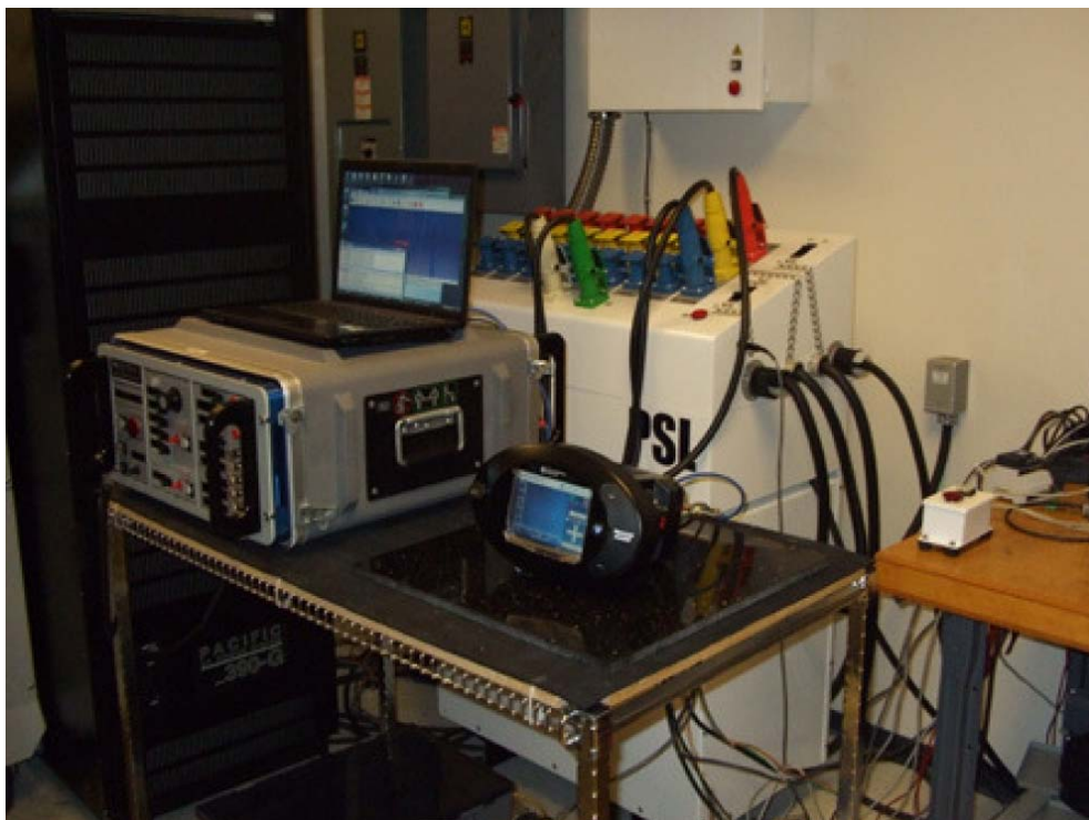
照片 2：被测仪器和测试环境