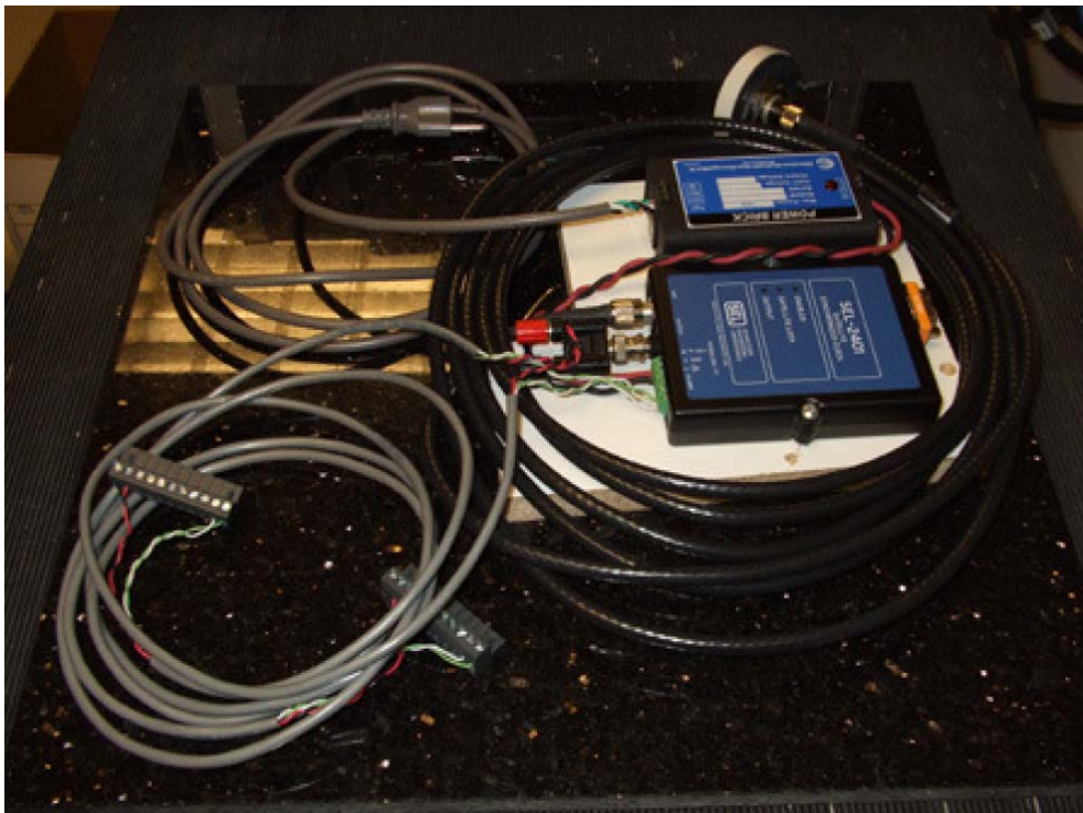
照片 4：被测仪器测试所要求的辅件